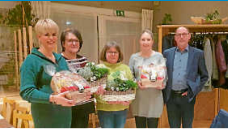
Ehrungen und Verabschiedungen verdienter Mitarbeiter