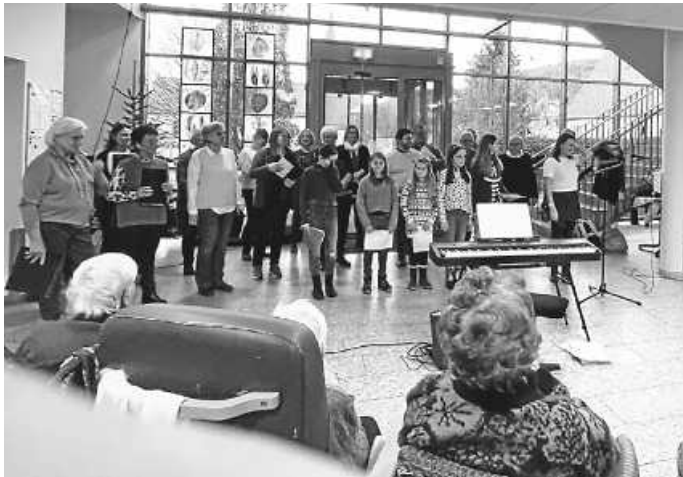
Wo-Menvoices mit dem Kinderprojektchor

Somit zeigt sich wieder einmal, dass Musik und Gesang eine positive Stimmung erzeugen und Erinnerungen wecken können. Es war schön zu sehen, wie die Bewohner Freude daran hatten und sich durch den Auftritt unterhalten fühlten. Die Heimleitung bedankte sich herzlichst bei den Kindern, Sängerinnen u. Sängern und erwähnte, dass so ein Auftritt immer eine willkommene Abwechslung für die betagten Bewohner des Altenzentrums ist.