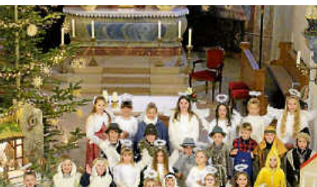
Krippenspiel in Egesheim