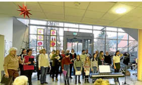
Besuch im Altenzentrum St. Ulrich Wehingen