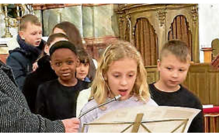
Adventsfeier der Grundschule Reichenbach