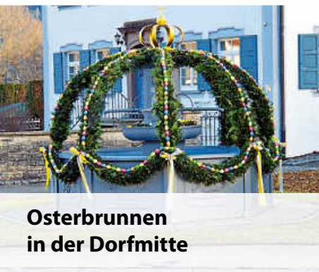
Osterbrunnen in der Dorfmitte