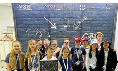
GGW bei Jugend forscht