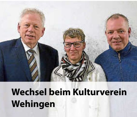
Wechsel beim Kulturverein Wehingen