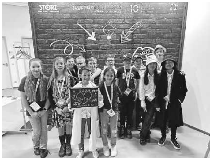
TeilnehmerInnen des GGW bei Jugend forscht