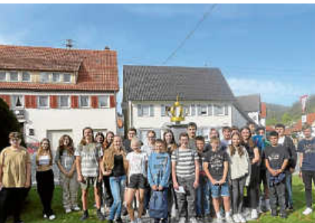
Pilgerweg mit den Firmlingen