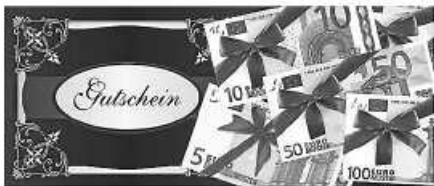
Gutscheineprogramm endet zum Jahresende. Besitzer von Gutscheinen aus den Jahren 2021, 2022 und 2023 werden gebeten, diese bis 31.12.2023 einzulösen. Gutscheine aus früheren Jahren können leider nicht mehr eingelöst werden.