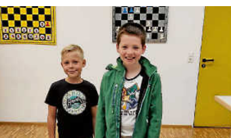
Bezirks Jugend Play-Off Turnier in Rangendingen U10