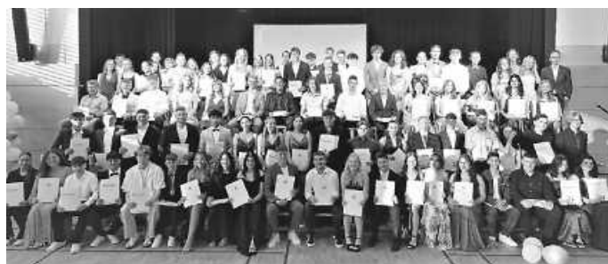
Die Abschluss-Schüler 2023 der Realschule Gosheim-Wehingen