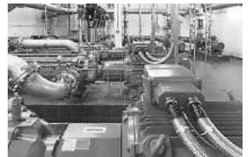
Imposant sind die verschiedenfarbigen Pumpen und Aggregate, die mit unzähligen Rohren und Leitungen miteinander verbunden sind.