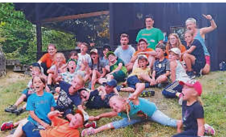
Wanderung mit Übernachtung auf der Lau-Hütte