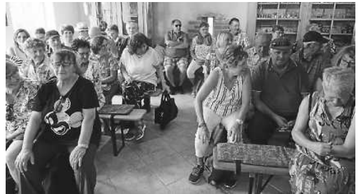
Zum Abschluss der Führung ein Aroniaschnäpsle

Alle waren sich einig: Es war ein wunderschöner Tag mit allem, was der Seele guttut: „schwätze, esse, trinke, singe und lache“.