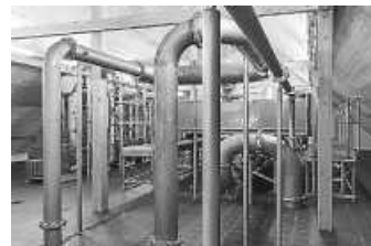
Voll bis unters Dach: Diese Anlage ist für die Entsäuerung des Trinkwassers zuständig.