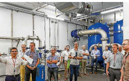
Neues Rückgrat der Wasserversorgung