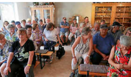
Ausflug ins Oberschwäbische