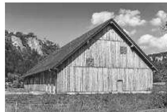
Wie ein riesiger Schuppen kommt das Wasserwerk Langenbrunn daher, drinnen aberherbergt es aber modernste Technik.

https://1drv.ms/f/s!ArJlgrRWmyJlgsGWEujDGGoZgfzE?e=xX5PxG