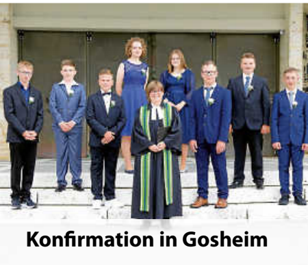
Konfirmation in Gosheim