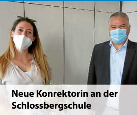
Neue Konrektorin an der Schlossbergschule