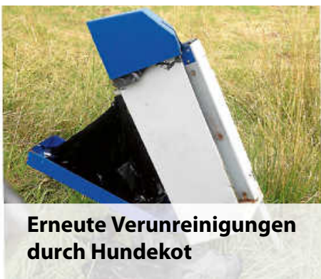
Erneute Verunreinigungen durch Hundekot