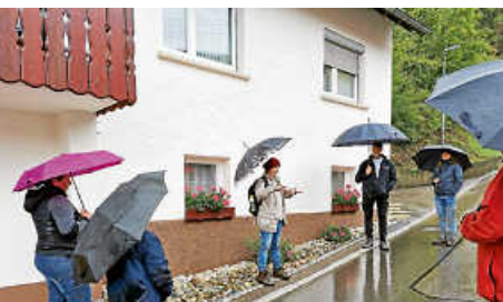
Geologieführung: So „steinreich“ ist Reichenbach