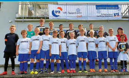
D-Jugend VR Cup