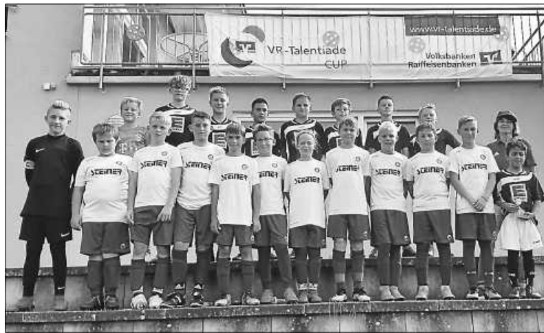
D-Jugend VR Cup

Das Tolle an diesem VR-Cup-Tag war auch, dass unsere eigenen Mannschaften ein besonders starkes Turnier spielten und unsere D1 sich nur im Finale geschlagen geben musste.