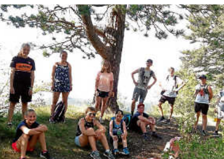
Wanderung mit den Minis